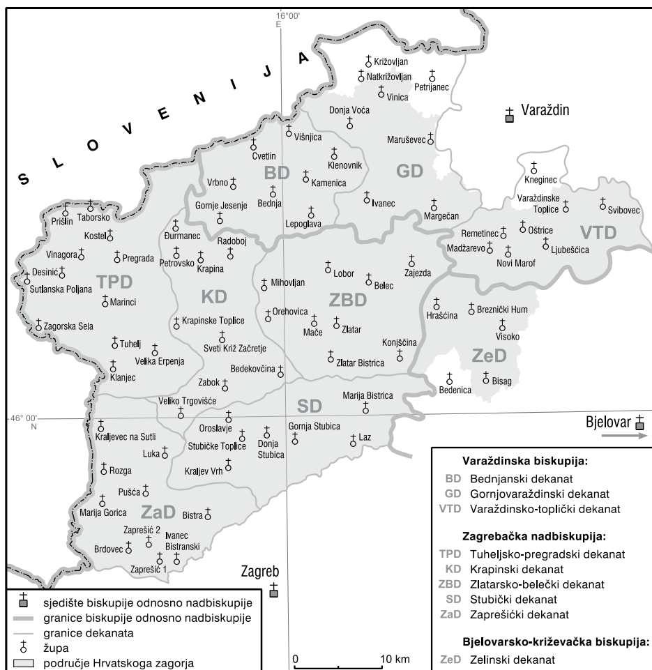
Karta 2. Današnji crkvenoteritorijalni ustroj na zagorskom području; prema Enciklopediji Hrvatskoga zagorja , Zagreb 2017.

Zagorski dio Zelinskoga dekanata čine župe Bisag, Breznički Hum, Hraščina i Visoko.