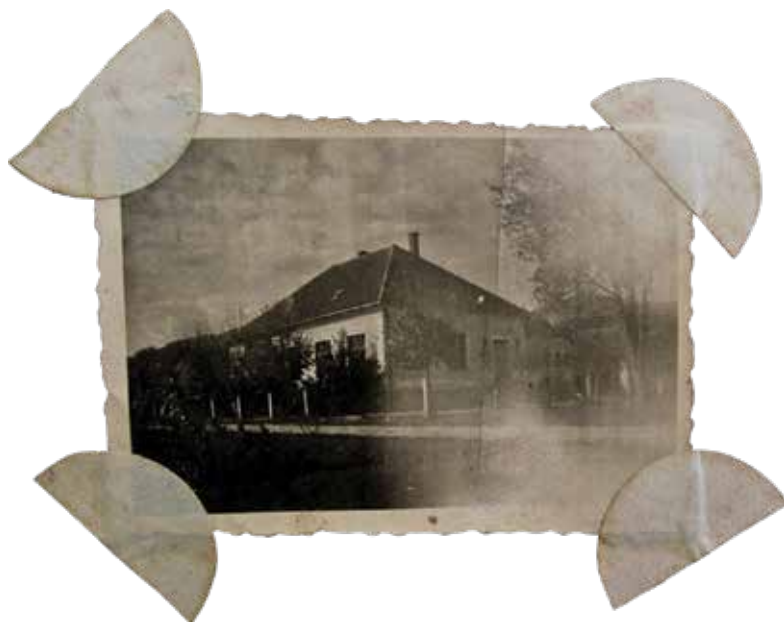
Slika 1. Škola u Šemnici Gornjoj, 1931., Školska spomenica Šemnica Gornja

(1931) 40 i Gornji Kraljevec (1938), 41 Velik broj novootvorenih škola govori o površinom velikom području koje je, s obzirom na velik broj djece, bilo nedovoljno pokriveno mrežom škola, a koje su, osim toga, bile dosta dislocirane od sela s najvećim brojem školskih obveznika. Zbog tih je razloga kotar Zlatar imao dosta izražen problem nepolaska škola i potrebu otvaranja novih kako bi se u školu upisali i obveznici iz onih sela koja su bila dosta udaljena od postojećih škola pa ih oni uopće nisu pohađali. Pojačani pritisci stanovništva Hrvatskoga zagorja (Hrvatske) i određena promjena državne politike prema »prečanskim krajevima«, a i konačno donošenje Zakona o narodnim školama (1929) 42 , rezultirali su većim osnivanjem novih škola u kotaru Zlatar i općenito u Hrvatskom zagorju.