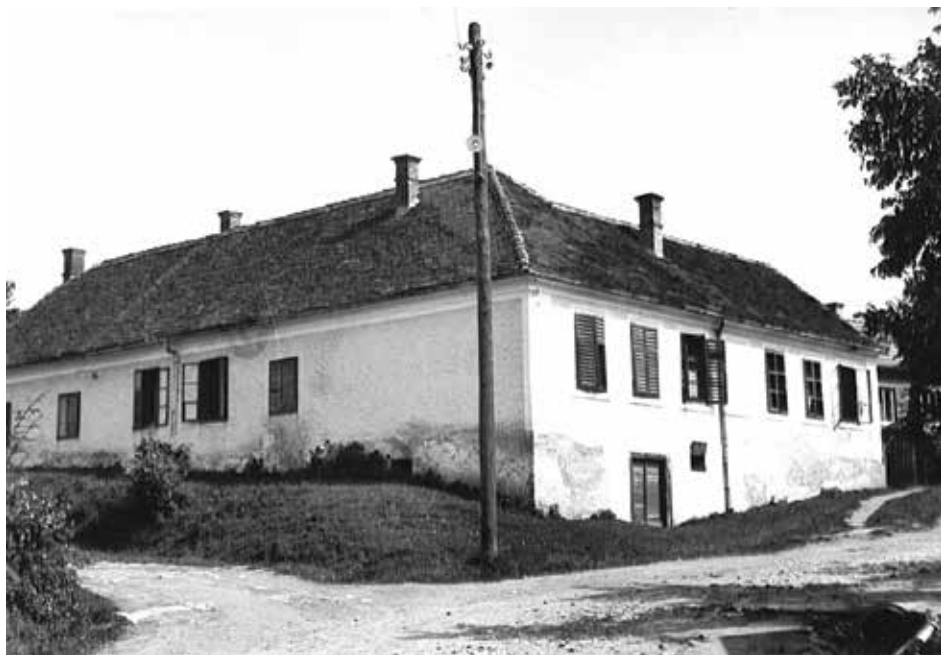
Slika 2. Djevojačka škola u Ivancu, krajem 1940-ih godina, Arhiv OŠ Ivanec

U kotaru Ivanec potrebama nije odgovarala ni jedna škola jer su sve imale prevelik broj učenika u razredima, a zbog toga i velik broj neupisanih obveznika (osim ivanečkih škola). 49