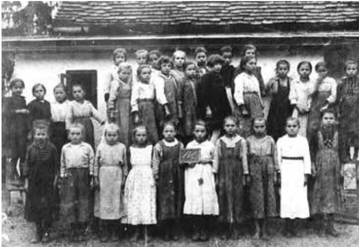
Slika 3. Četvrti razred djevojačke škole u Ivancu, 1930-ih godina

Velik broj učenika u razredu, slaba opremljenost školskim materijalom, rad učenika kod kuće te neredovit polazak škole uzrokovali su i njihov slab uspjeh na kraju školske godine, ponajviše u smislu prelaska u viši razred što su u svojim godišnjim pregledima konstatirali i školski nadzornici. 77 Činjenica je ipak da su seoska djeca upravo preko osnovnih škola i svojih učitelja, s kojima su se uključivala u kulturna događanja i općenito društveni život svakoga mjesta, prvi put ulazila u većoj mjeri u sferu javnosti te su tako s vremenom postajala pokretačima određenih promjena u hrvatskom društvu.