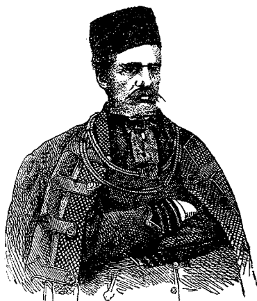
Slika 11. Ivan Kukuljević Sakcinski (preuzeto iz Naše gore lista , br. 33. od 25. XI. 1862)

Janko Car također je jednom sastavio opširnu vijest o kazališnim predstavama održanim u Krapini 15. listopada 1842. Osim osvrta na pojedince koji su glumili u predstavama, Car je također opisivao i atmosferu koja je vladala u Krapini prije i nakon predstava. Nije zaboravio istaknuti kako su se, u duhu običaja toga vremena, sutradan ujutro, po završetku predstava popeli na obližnji »oholi hrid Čeha« gdje se pucalo iz mužara i ushićeno pjevalo, a potom »sladkim i veličanstvenim kog upismo na glasovitom bardu duhom opojeni« sišli u mjesto i pozdravili s muzikom »mnogozašlužnoga spisatelja i probuditelja narodnosti naše visokoučenoga g. Dra Ljudevita Gaja«. Car je, naime, kao i mnogi njegovi suvremenici smatrao kako planinski vrhunci i čisti zrak bistre um i jačaju moral. Stoga i to penjanje na uzvisinu ponad Staroga grada uočavamo kao redovitu pojavu u Krapini tijekom koje se uživa u zanesenosti penjanjem i promatranjem okolice. Osim toga puritanističkog učinka, brdo Čeh u njegovim očima ima dodanu vrijednost, utoliko što je ono prijestolnica jednog od, kako se vjerovalo, trojice braće koji su osnovali Češku, Poljsku i Rusiju. Car naglašava tu glasovitost Krapine kao »kolijevke svih Slavjanah« u kojoj se, eto, izvode i komedije dell'arte kao i u Beču, Zagrebu i drugim europskim gradovima.