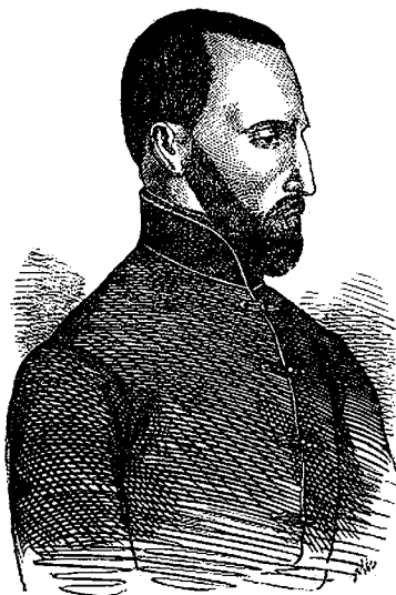
Slika 10. Stanko Vraz

Prilikom jednoga svojega boravka u Zagrebu Sreznjevski je s Vrazom posjetio i Krapinu te sastavio pismo neimenovanoj posestrimi koje je u 37. broju Danice ilirske od 11. rujna 1841. objavljeno pod naslovom List o teatru u Krapini . Sreznjevski u članku ne skriva svoje oduševljenje Krapinom, koja je uoči predstave »naličila na pazar, gde se narod na harpe nakupljen šetje« 88 , a poslije predstave okupljalo se u Vojkffyjevim dvoranama gostionice »K ilirskoj Danici«, gdje je kazališni orkestar svirao narodne napjeve, a gosti pjevali i plesali do zore. Sreznjevski ističe kako je predstava »čutjenje prekrasnoga i plemenitoga«, a ne luksuz, što može »potvrditi svaki, koi je bio prešao medjaš svoje varmedjie«. 89