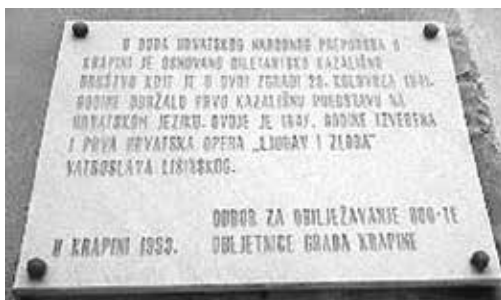
Slika 8. Spomen-ploča na pročelju zgrade u kojoj su održavane kazališne predstave u Krapini sredinom XIX. st.

»U DOBA HRVATSKOG NARODNOG PREPORODA U KRAPINI JE OSNOVANO DILETANTSKO KAZALIŠNO DRUŠTVO KOJE JE U OVOJ ZGRADI 29. KOLOVOZA 1841. GODINE ODRŽALO PRVU KAZALIŠNU PREDSTAVU NA HRVATSKOM JEZIKU. OVDJE JE 1847. GODINE IZVEDENA I PRVA HRVATSKA OPERA »LJUBAV I ZLOBA« VATROSLAVA LISINSKOG. ODBOR ZA OBLIJEŽAVANJE 800-TE OBLJETNICE GRADA KRAPINE U KRAPINI 1993.«