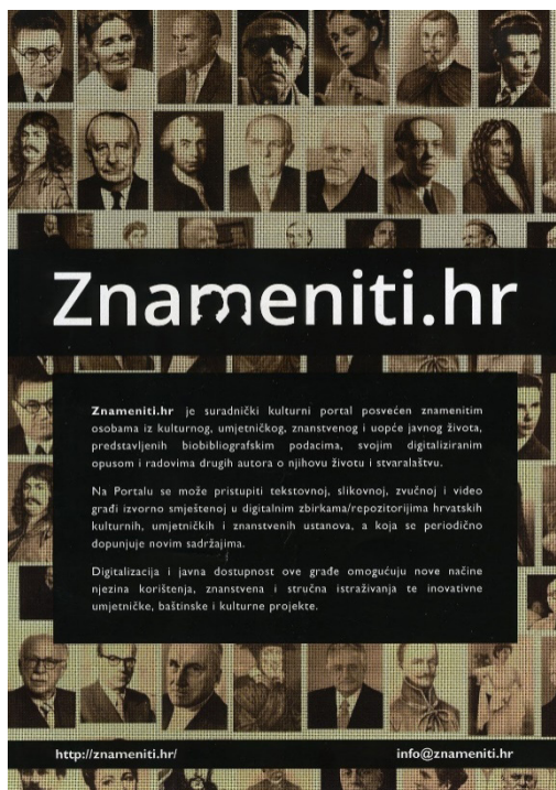
Promotivni letak za Znameniti.hr tiskan početkom 2019.

skih institucija omogućuje daljnji razvoj portala. Sredstva za digitalizaciju i objavu nove građe osiguravaju se dvojako, ne samo kroz suradničke, već i u okviru samostalnih projekata.