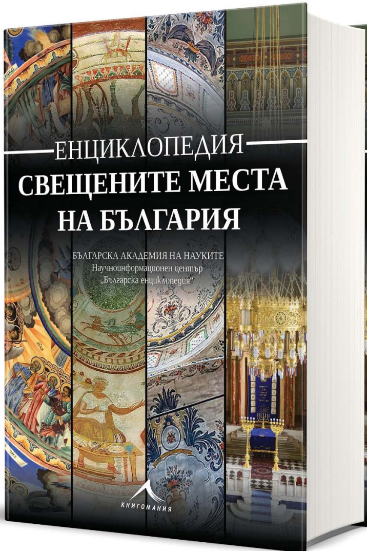
Encyclopedia Sacred Places of Bulgaria

graphic drawings: portraits, paintings, views, schemes. At the beginning of the 20 th century, encyclopedic material was also contained in some translated dictionaries. Specialised encyclopedic reference books appeared on the market: on economics, philology, literature, medicine, etc.